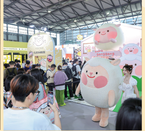
2023 PTS上海国际潮流玩具展

<DongDong and Friends> 是以温暖的羊毛和变化万千的云朵为素材，开发设计的角色品牌。5个可爱的角色带小朋友进入甜美的梦乡，有趣的游戏让孩子们拥有稳定的情绪，帮助他们健康成长。2021年，<Flying DongDong> 与中国的泡泡玛特签约，推出了多款艺术玩具类商品。2022年，<Flying DongDong> 与中国的网易公司展开商业合作，与网易旗下的手游<Eggy Party> 进行IP联动，并签订了该游戏全球化版本的合作协议。2023年3月，在该游戏的人气角色投票中<Flying DongDong> 夺得榜首(530万票)。2023年12月，《蛋仔派对》× Flying DongDong正式签约，达成独家战略合作伙伴关系，在2024年-2025年期间将会推出更多精彩活动，更多定制联动内容已在筹备中！