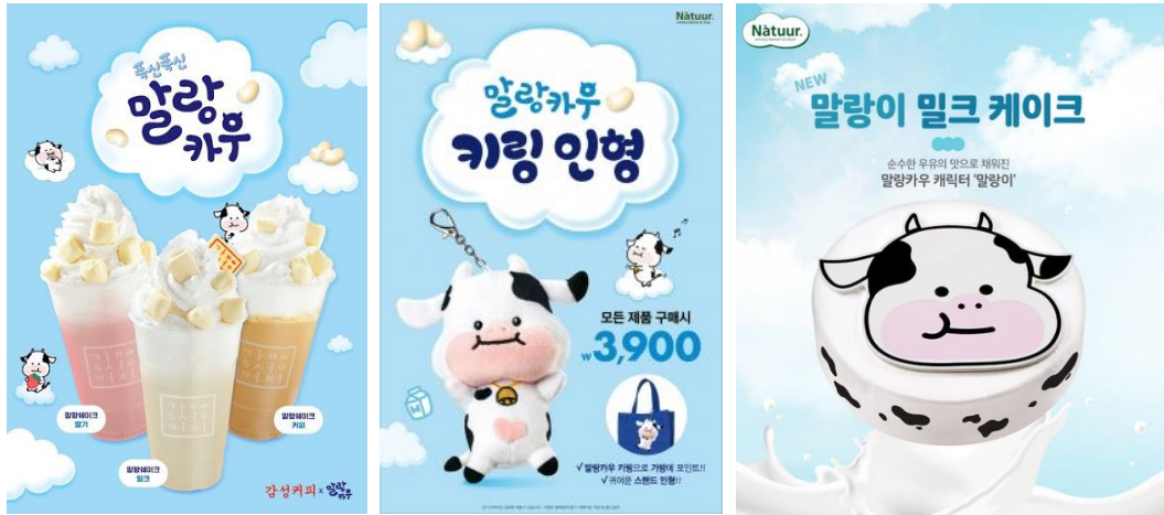
감성커피 및 나무루 콜라보 사례